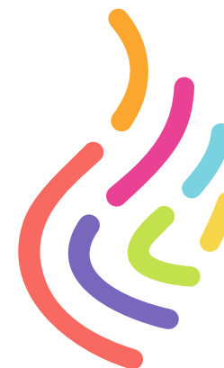
Полноцветная версия . Основная версия эмблемы. Используется для полноцветной печати

Одноцветная версия используется в тех случаях, когда полноцветная печать невозможна.