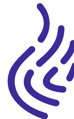
Одноцветная версия в синем цвете. Используется для печати на ч/б принтере, гравировке на сувенирной продукции